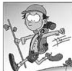
6. En Xesco, de petitó, va ser escolta i llobató.