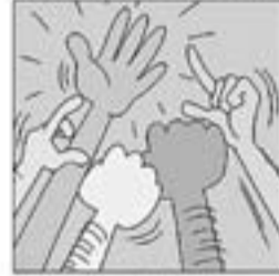
36. Amb "Els cinc dits d'una mà" fa pinya per actuar.