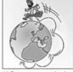
44. Cantant com un rodamón en Xesco corre pel món.