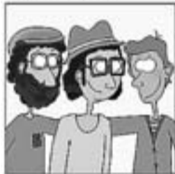
19. Al Parc de la Ciutadella, en Xesco, en Sisa, l'Arnella,