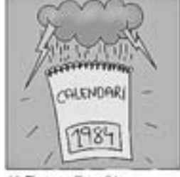
46. Fins que l'any 84 una depressió el va abatere.