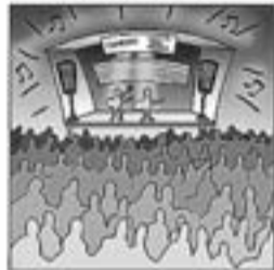
22. ... van fer un dels festivals més sonats i colossals.