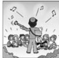
24. I canta per als petits que escolten embadalits.