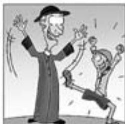
7. I aprençut de mossèn Bartlle de fer pinya i de fer espalla.