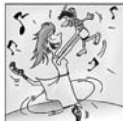
5. Que cantava tot el dia pels seus fills amb alegria.