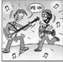
31. Amb Pete Seeger, dia i nits, passa un temps a Estats Units.