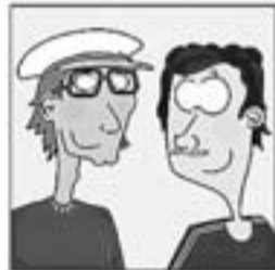
21. ... els Batista i en Jaraba, i una llista que no acaba,