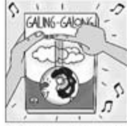
41. També treu «Galing-galongi» amb cert regust de folk-song.