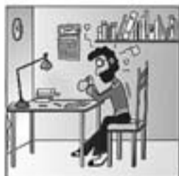
10. Torna aquí i amb energia tria fer pedagogia.