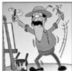
3. Era artista, era poeta, i escrivia amb la mà dreta.