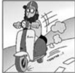
28. Viatjant amb la Lambretta, amb què fa vols d'oreneta.