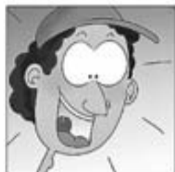
9. Coneix món, aprèn lliçons i també noves cançons.