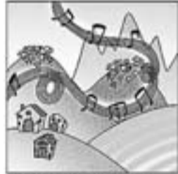
27. Fa recerca de cançons i arriba per mil racons.