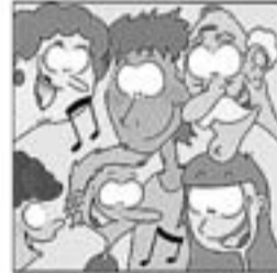
30. Que fa conèixer als infants i que encanten els més grans.