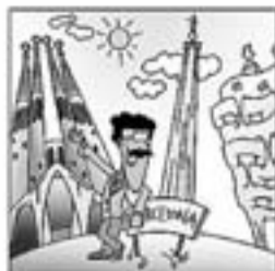
2. De pare barceloní una cosa de no dir.