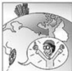
8. Mil nou-cents seixanta-dos va a Los Angeles, rumbós.