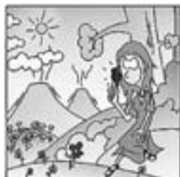
4. Sa mare, era olotina, i una dona culta i fina.