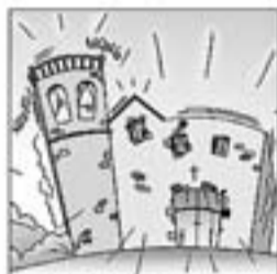
14. I en fa una de sonada: se'n va a la Caputxinada.