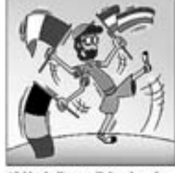
45. Va de Funa a l'altra banda Bèlgica, Itàlia i Holanda.