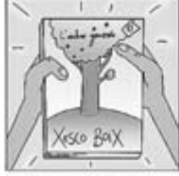
40. I fa un llibre preciós que es diu «L'arbre generós».