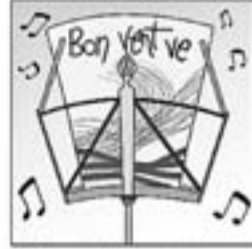
35. El seu primer cançoner que publica és «Bon vent ve».