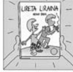
42. I un més, «Lireta lirana», que és un llibre, una moixaina.