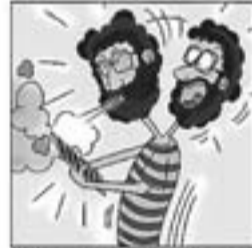
29. Com un nou Joan Amades recull cançons rovellades.