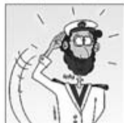
17. Com un ocell eixalat, a marina fa el soldat.