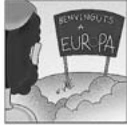
33. Torna, i passa per Europa cantant per un plat de sopa.