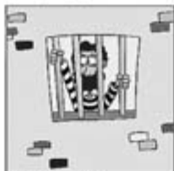
16. És més, l'any 67 me'l detenen, al pobret!