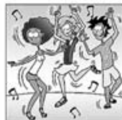
12. ... de ressò internacional que engresquen el personal.