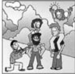
25. Amb els "Ara va de bo" en Xesco té un altre so.