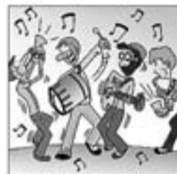
18. Amb tot, l'any 68 el Grup de Folk dona fruit.