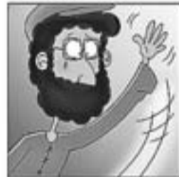
23. Temps després en Xesco, sol, altre cop aixeca el vol.