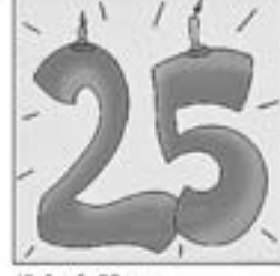
48. Ara fa 25 anys, fem-ne memòria, companys.