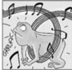
26. I fa gresca i fa sarau tot cantant "El gripau blau".