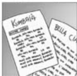
13. "Bella ciao", "Kumbala" i molt folk americà.