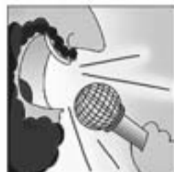
11. I comença a divulgar cançons per sucari-hi pa.